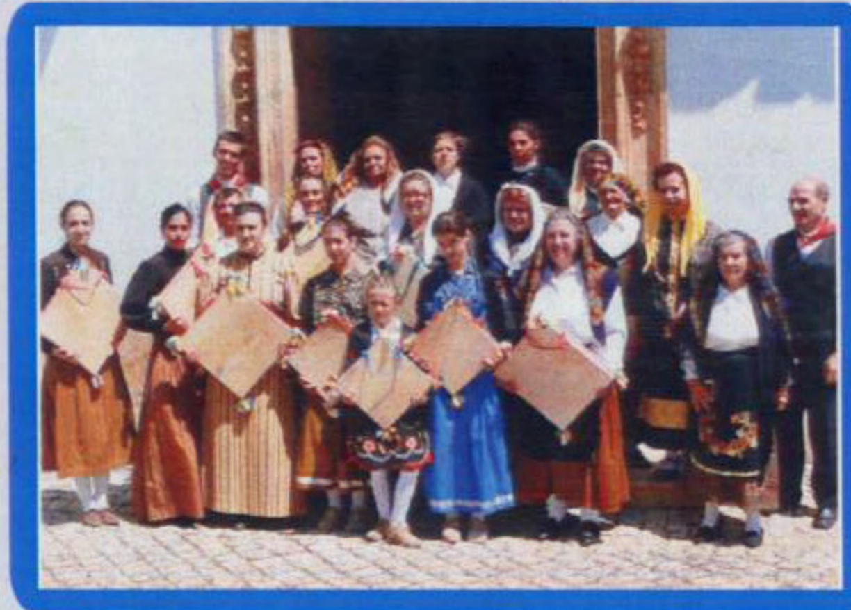
Grupo Etnográfico Modas e Adufes

11H00 - Procissão da Ressurreição, e visita ao Santo Sepulcro. 11H30 - Eucaristia na Igreja Matriz. 16H00 - Tarde Cultural. - Grupo Etnográfico - Modas e Adufes. - Grupo Musical ECLIPSE.